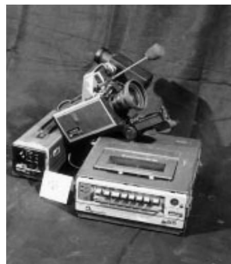
Recorder VHS Panasonic portable avec recorder/caméra