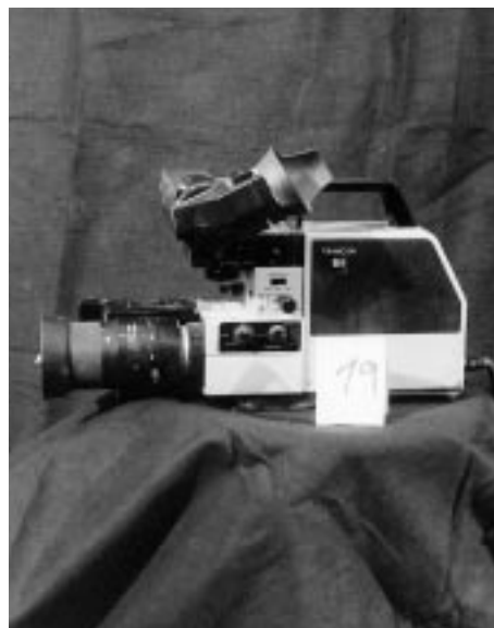
Trinicon WEGA (Sony) Farbkamera VCC-4290