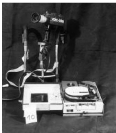
Un «Portapak» légendaire avec des bandes 1/2-pouce, Sony, Japan Standard 1; avec caméra Sony 3450 et videorecorder AV3420 portable

Aux Etats-Unis et au Canada, le Portapak a immédiatement suscité l'intérêt d'artistes, d'étudiants, de hippies, de bricoleurs de talent et de militants de la mouvance soixante-huitarde. A New York s'est formé un premier groupe de vidéastes, dont on trouve trace des activités dès 1970 dans le magazine Radical Software . Cette revue contenait une foule de renseignements d'ordre technique, de rapports d'expérimentations, et d'idées nouvelles quant à l'utilisation de la vidéo: pour le travail d'animation dans les quartiers, ou d'animation auprès des enfants et des adolescents, pour soutenir le combat des mouvements de protestation. Le premier numéro portait en sous-titre la mention «Le mouvement TV alternatif», et l'éditorial affichait le programme: «Le pouvoir ne se mesure plus seulement en termes de terre, de travail ou de capital, mais par l'accès aux informations et aux moyens de les diffuser. Aussi longtemps que les outils les plus performants seront aux mains de ceux qui détiennent les informations, aucune vision alternative de la culture ne pourra se mettre en place. Si nous ne concevons et n'expérimentons pas de structures d'information