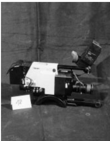
Sony Farbkamera DXC-1800, 1 Röhre