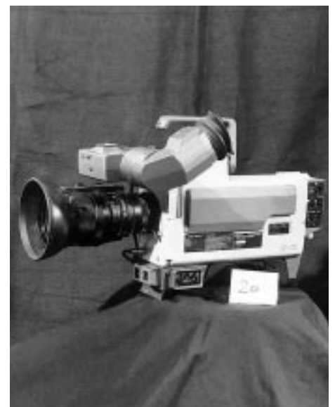
Sony Farbkamera M3 (3 Röhren)