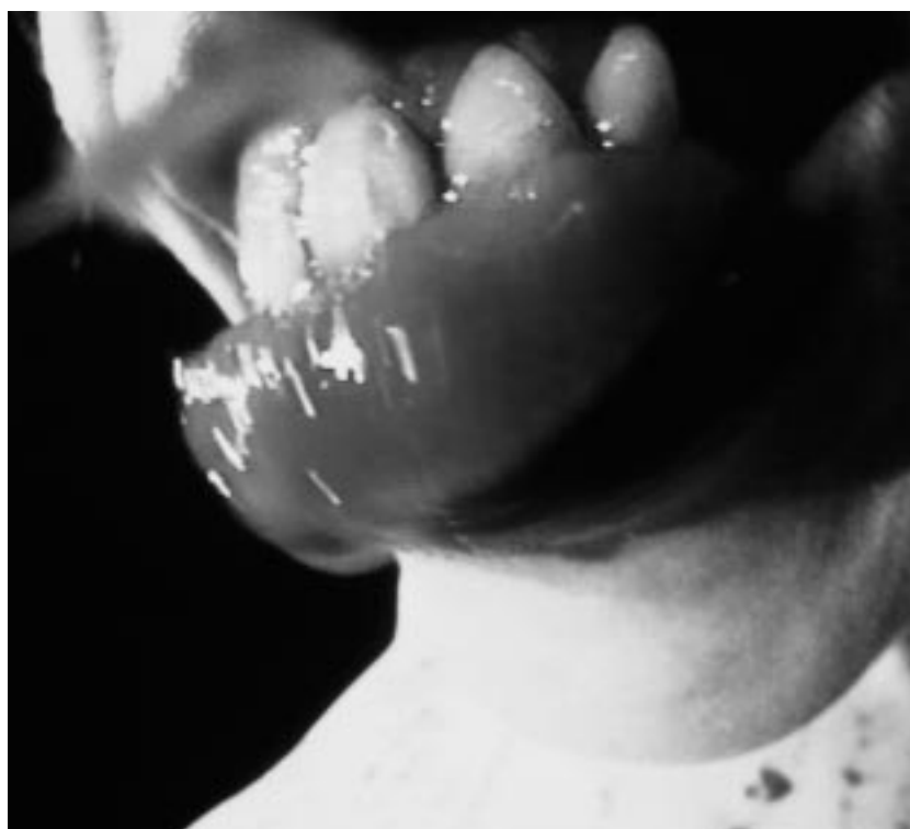
«Blutclip» di Pipilotti Rist, 1993

Dal 1984, a Saint-Gervais, Ginevra, si sta sviluppando un'intensa attività nel campo dell'immagine e in particolare in quella delle arti elettroniche. Quest'attività si è fatta conoscere in un primo tempo essenzialmente nel campo del video di creazione. Una delle manifestazioni importanti, che segnalò al pubblico svizzero e straniero il nostro impegno per il video, fu senza dubbio l'organizzazione di una biennale: la Settimana Internazionale del Video. Nel corso della prima edizione del 1985, l'artista Bill Viola, invitato per un seminario e una retrospettiva della sua opera, offrì alla nostra istituzione la sua creazione-video più recente. Questo dono costituì il primo pezzo della nostra collezione d'arte video. In seguito la nostra raccolta si è molto ampliata e comprende attualmente un migliaio di titoli, diventando così una delle principali collezioni video del mondo. Essa si è costituita, nel corso degli anni, attorno a due assi principali: da una parte la salvaguardia delle opere video d'artisti internazionali, e dall'altra, la