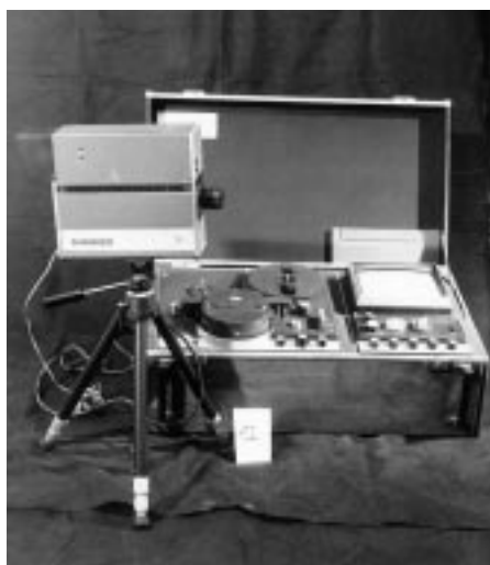
Videorecorder, bandes 1/2-pouce, Standard Shibaden avec caméra Shibaden HV-15 et recorder avec monitor SV800