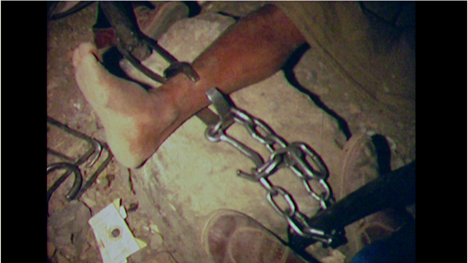
Yémen à vif , CICR, André Rochat, 1969 (V-F-CR-H-00125)