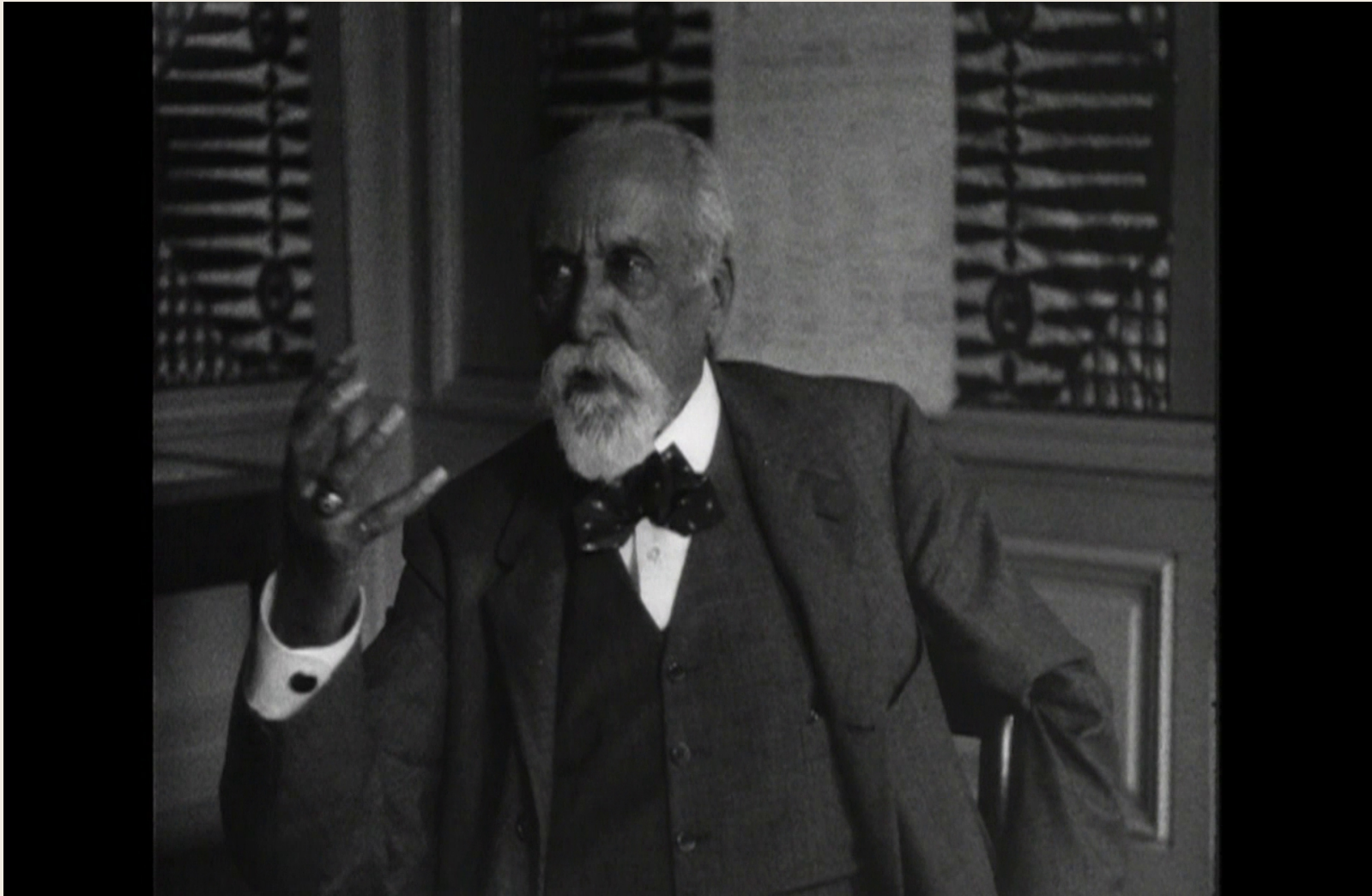
Le Comité international de la Croix-Rouge à Genève : ses activités d'après-guerre, CICR, Jean Brocher, 1923 (V-F-CR-H-00013-A)