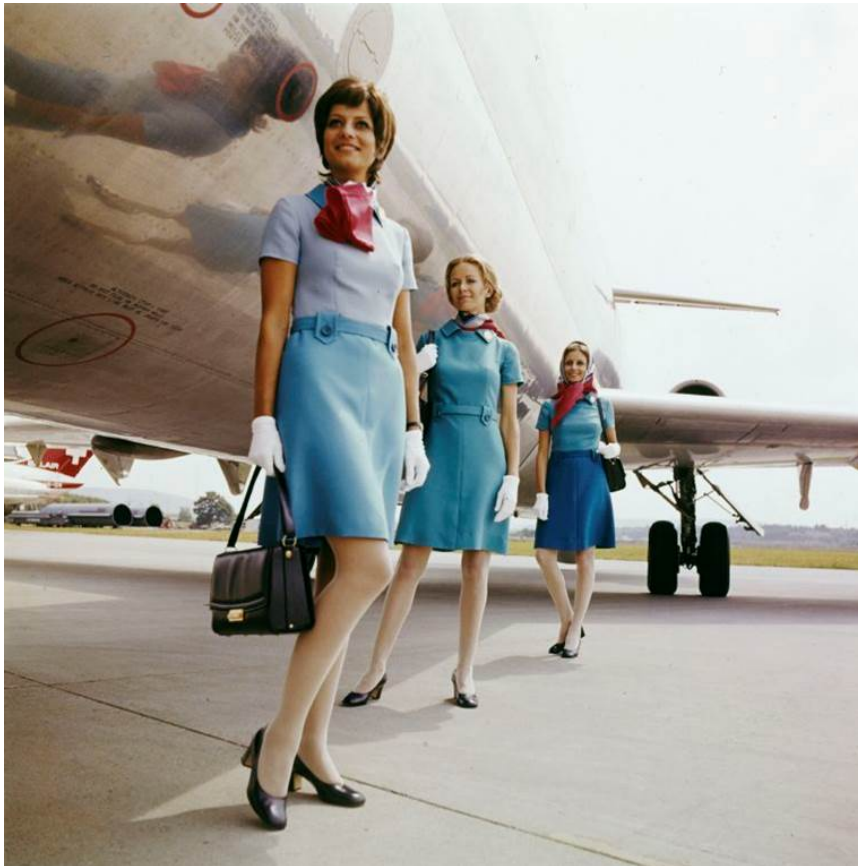
Uniform FA 1960 bis 1970 Neu: Hostessen der Swissair in der von 1970 bis 1977 getragenen Uniform