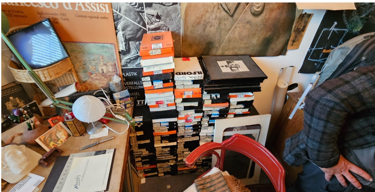
Einblick in Claire Niggli's Fotobestand in einer Mansarde am Claraplatz. Zustand vor der

Zahlreiche Basler Fotograf:innen wurden angeschrieben. Jene, die an der Umfrage teilnahmen, lieferten interessante Resultate; erwartungsgemäss sind grosse Bestände darunter. Einige Beispiele: