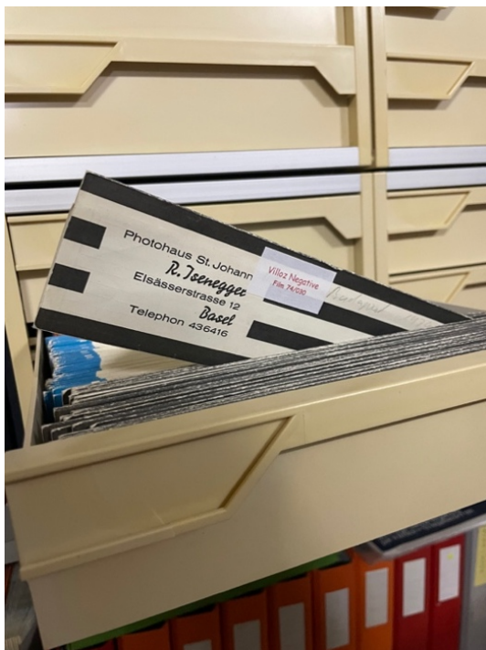
Impressionen aus dem Tramclub-Archiv.