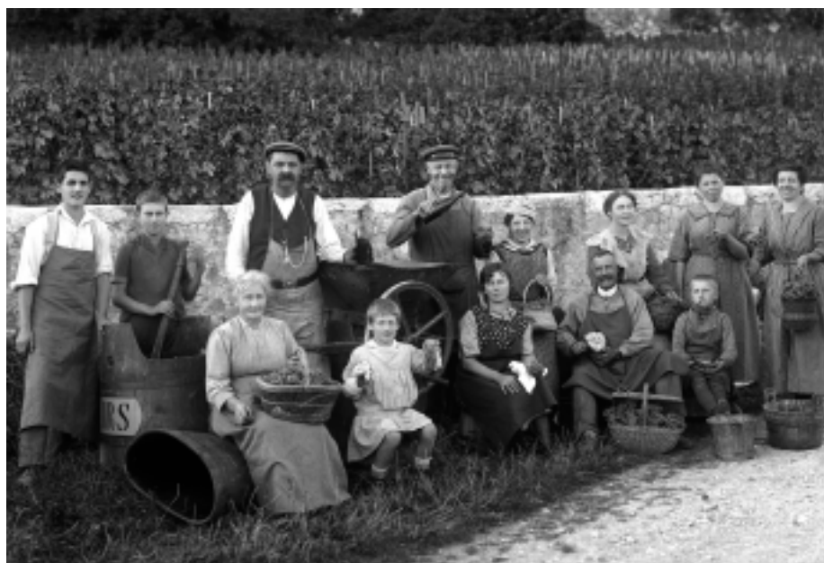
Fonds Pierre Hirt.

Einige Funktionen wurden speziell unseren Bedürfnissen angepasst wie z.B. die News und die Links. Schliesslich wurden die Inhalte ins CMS eingegeben, so dass wir einigermassen pünktlich am 8.1.2007 die neue Website frei schalten konnten.