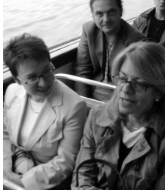
Seminaire Memoriav à Lugano, 29. et 30.8.2006.

Les séries de projections «Réalités suisses» et «Sortie du labo» permettent d'atteindre également un plus large public et de sensibiliser à la mission de Memoriav. D'autres