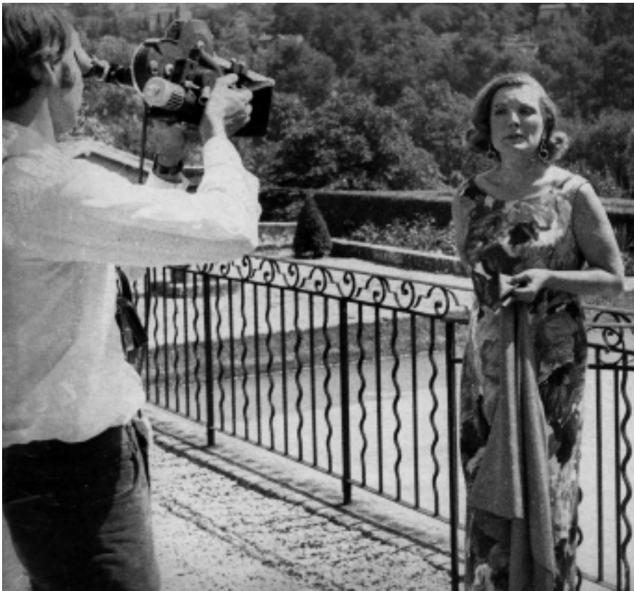
Intervista con Teresa Stich-Randall, emissione Carrefour del 26.12.69.

Oltre alla normale gestione dei progetti, nel 2006 Memoriav ha istituito un nuovo Centro di competenza Video: non un luogo concreto, bensì un punto d'incontro delle conoscenze latenti nella «rete» di Memoriav. Obiettivo: fornire consulenze utili a salvaguardare e rendere accessibili i documenti video. Il primo prodotto tangibile, da ordinare o scaricare, sono le raccomandazioni sulla conservazione (Memoriav Empfehlungen Video. Die Erhaltung von Videodokumenten). Il centro risponde anche alle domande più diverse.