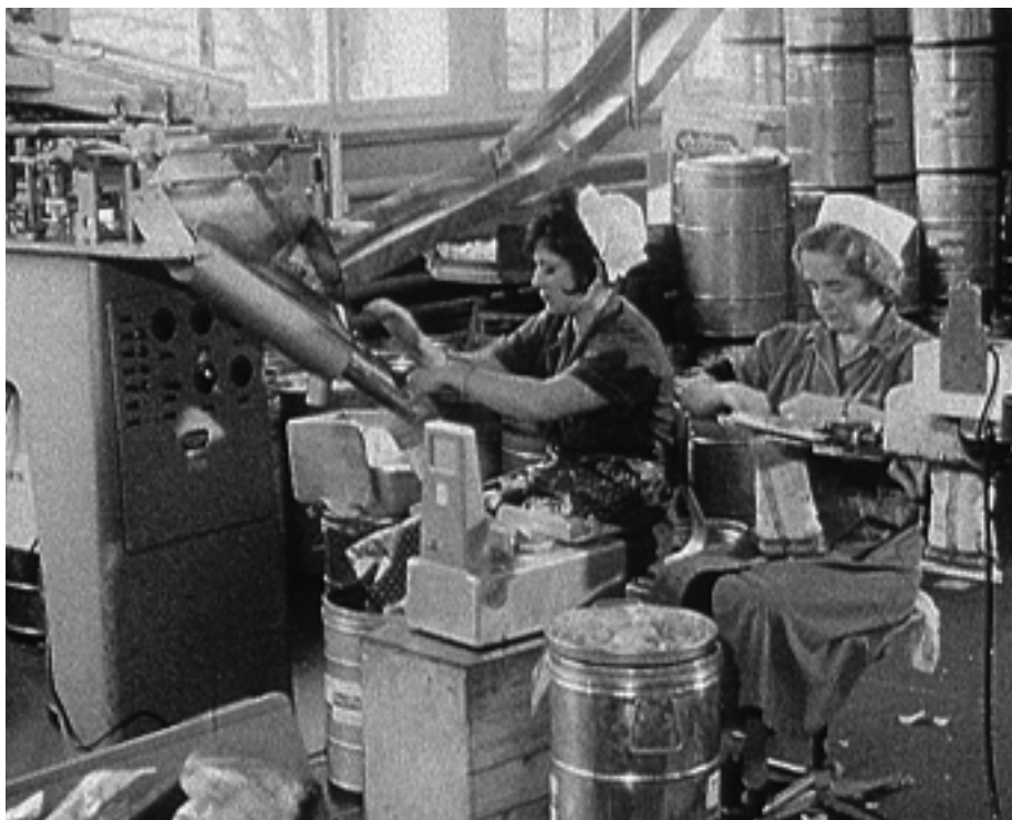
Dans l'usine à chips, photogramme de l'émission «Landwirtschaftliche Rundschau».

Les lecteurs et lectrices des publications de Memoriav savent depuis longtemps que les écrivains ne produisent pas uniquement