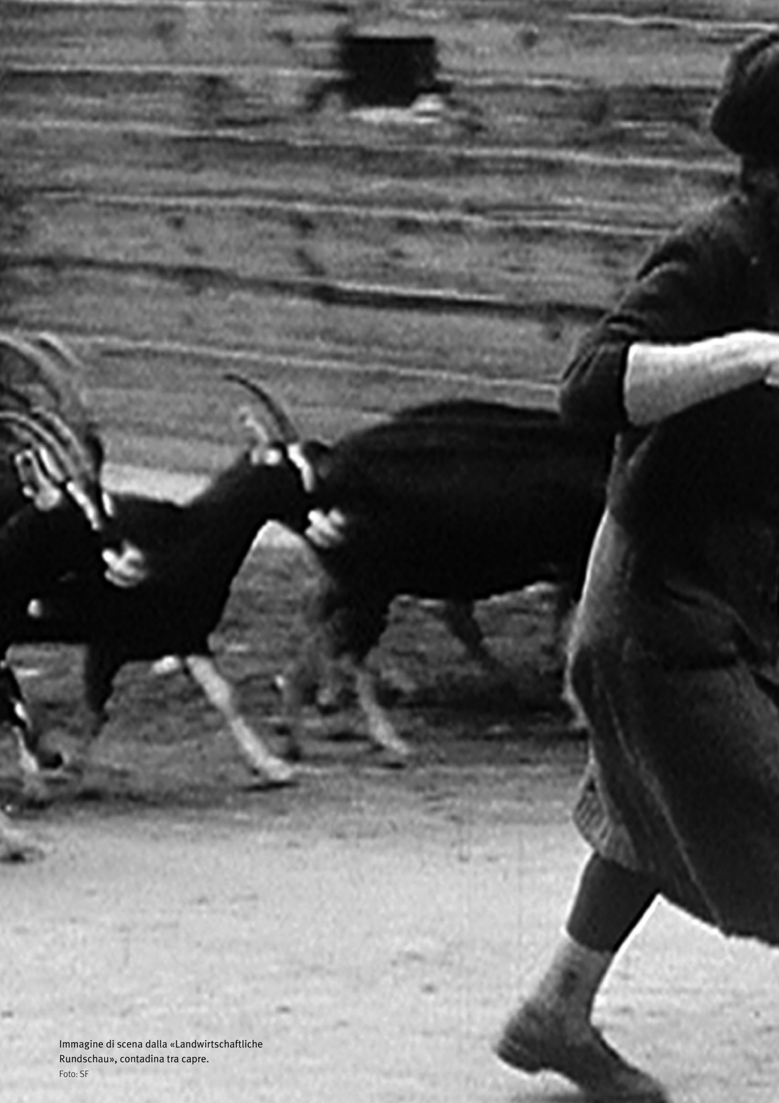
Immagine di scena dalla «Landwirtschaftliche Rundschau», contadina tra capre.