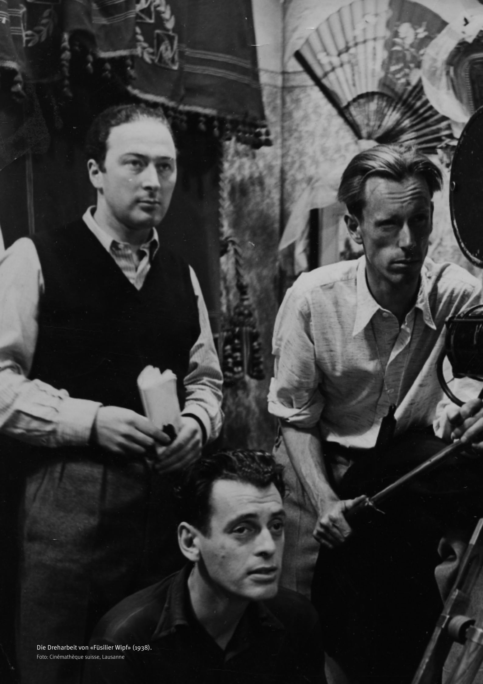
Die Dreharbeit von «Füsilier Wipf» (1938).