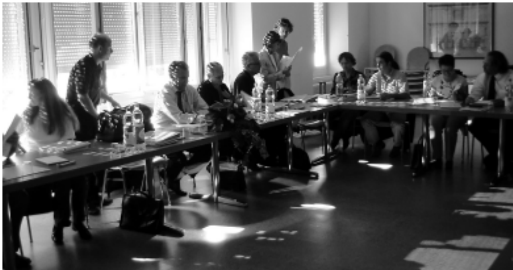
Seminario Memoriav a Lugano, 29./30.8.2006.

Censire le quantità e lo stato di conservazione dei documenti audiovisivi nazionali Questo obiettivo strategico figura già nello statuto sociale. Dopo i lavori svolti nel campo della fotografia, ora è la volta del settore filmico, ma con l'intento di inquadrare la situazione del patrimonio audiovisivo per poi delineare un programma d'azione sul