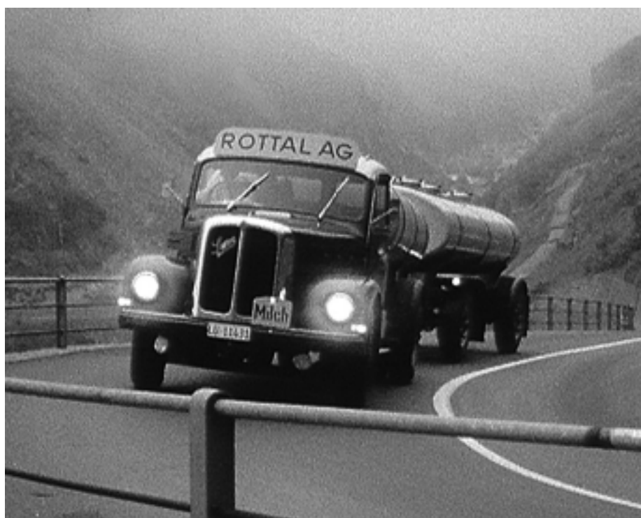
Szenenbild aus «Landwirtschaftliche Rundschau», Milch-Tankwagen.

Neben der Leitung und Begleitung von Projekten rief Memoriav im Jahr 2006 ein neues Videokompetenzzentrum ins Leben. Wobei darunter nicht ein Ort, sondern die im Memoriav-Netzwerk vorhandene gebündelte Kompetenz im Bereich Video gemeint ist. Seine Aufgabe ist die Erteilung von Ratschlägen, die der langfristigen Erhaltung und Zugänglichkeit von Videodokumenten dient. Das erste greifbare Produkt sind die bestell- oder downloadbaren «Memoriavempfehlungen Video». Die Erhaltung von Videodokumenten». Daneben wurden immer wieder Anfragen aller Art zu Video beantwortet.