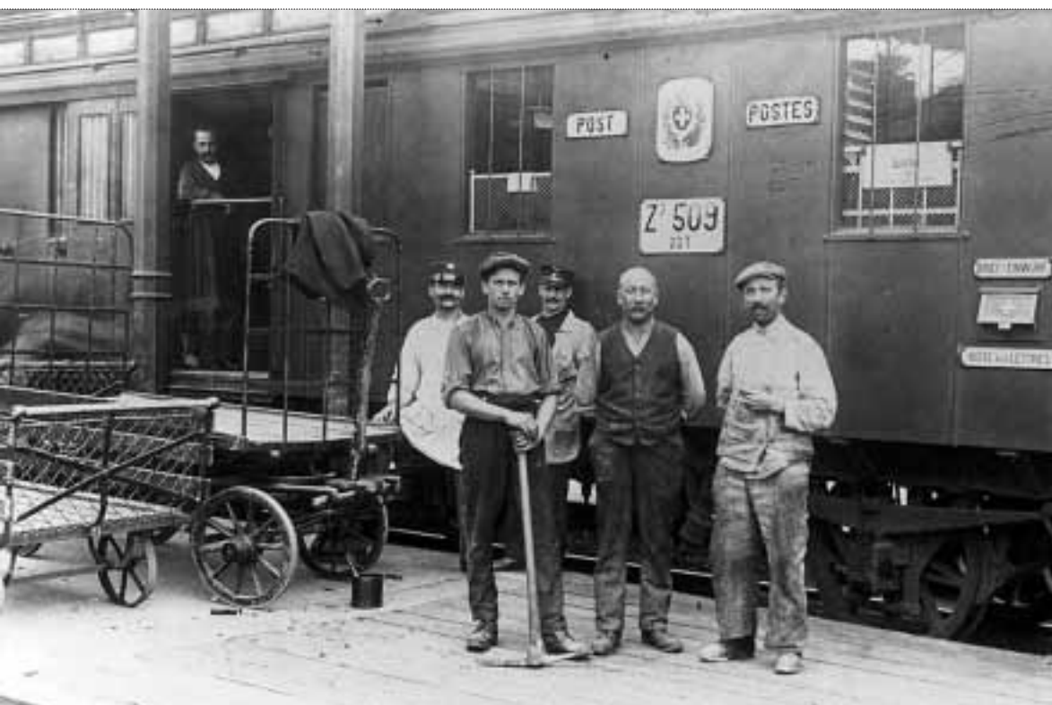
Bahn- und Postpersonal im Bahnhof Olten, 1910.