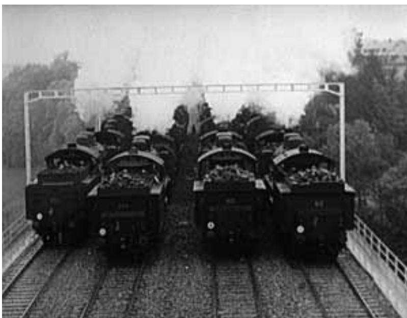
Filmstill «Die Berner Eisenbahn- brücke»