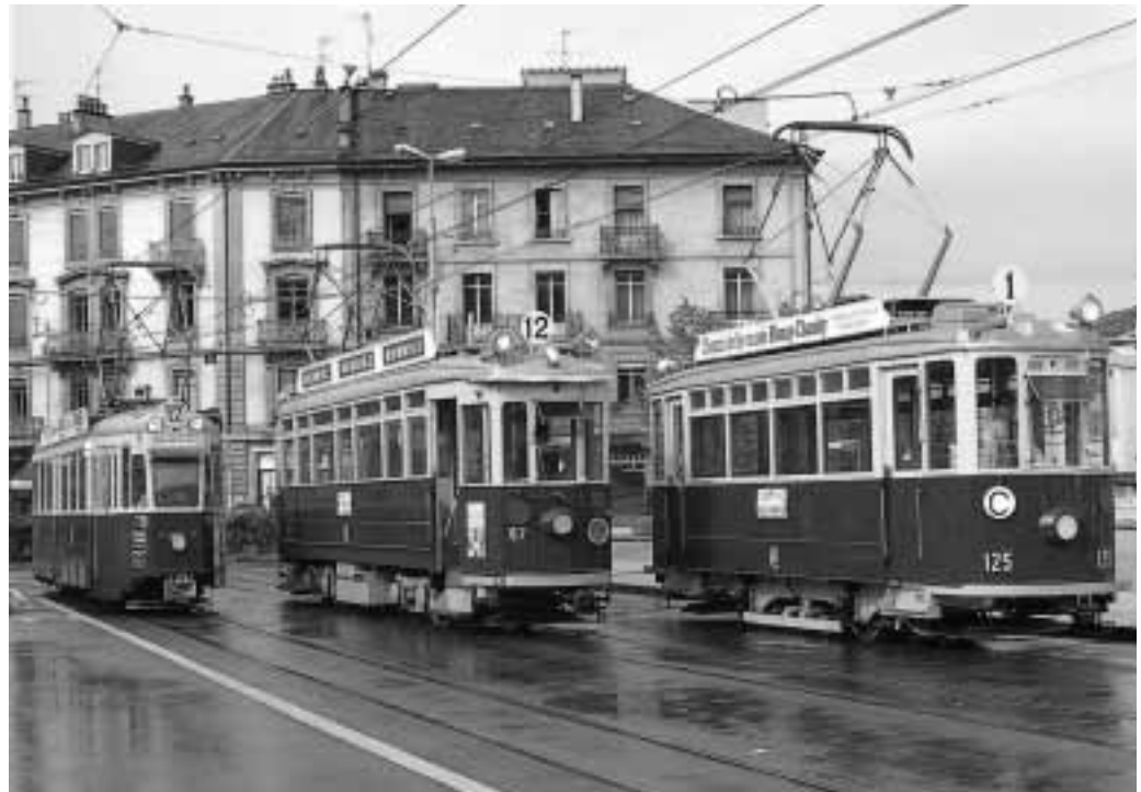
Parade des motrices historiques préservées par l'AGMT: Be 4/4 729 (1952), Be 4/4 67 (1901/1936), Be 2/2 125 (1920). Genève, Place Neuve, 29.04.2001

Im Jahr 1973 wurde in Genf der Verein (AGMT), der sich für ein Tram-Museum einsetzt und seit-her wichtige Zeugen dieser Geschichte sammelt. Einerseits sind dies Wagen der früheren «Genfer Gesellschaft der elektrischen Strassenbahnen», die in Stand gehalten, und restauriert und ab und zu sogar auf eine Fahrt geschickt werden. Andererseits sammelt der Verein wertvolle Unterlagen wie Bücher, Broschüren, Fotografien und Filme; an der Bahnexpo 03 hält mit einer kleinen Auswahl aus unserer Sammlung das Genfer Tram Einzug in das Verkehrshaus der Schweiz.