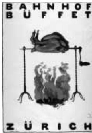
Bahnhofbuffet Zürich Augusto Giacometti, 1921