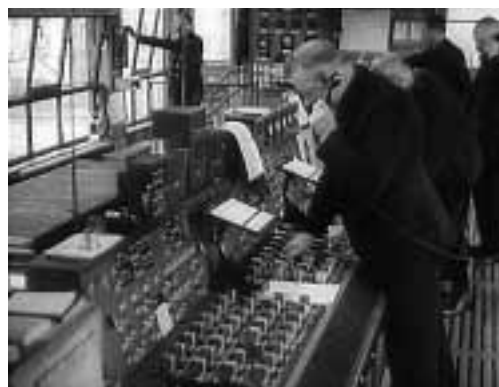
Filmstill «Männer der Schiene» © Cinémathèque suisse