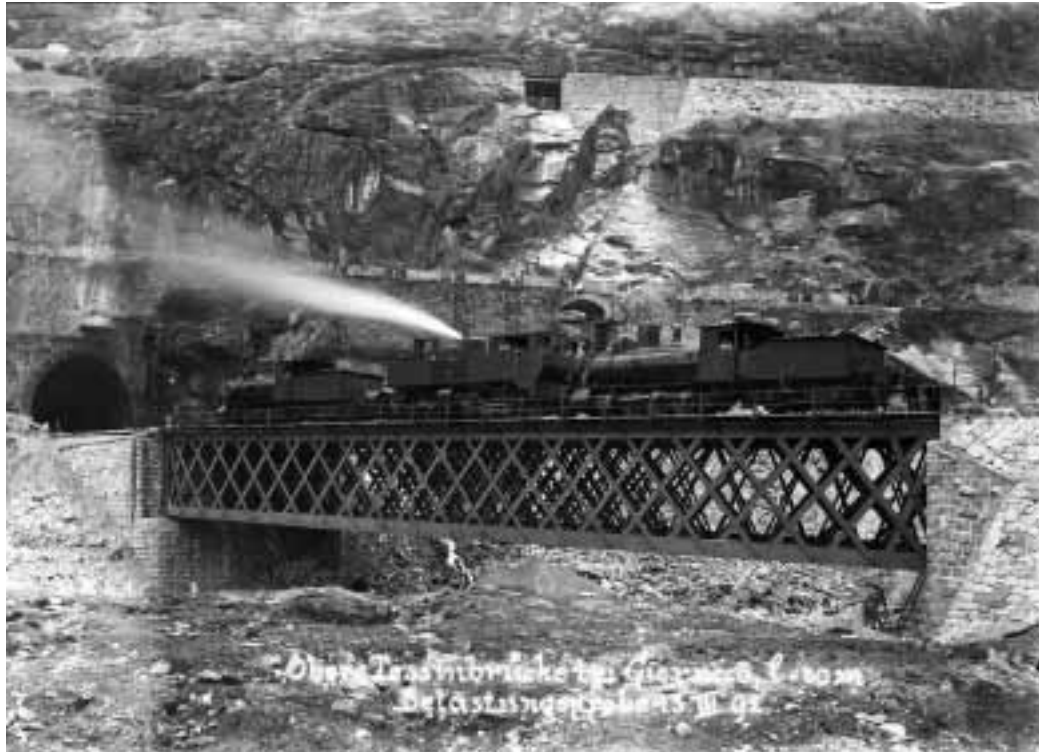
Brückenbelastungsprobe bei Giornico, 1891.

Das Herzstück der ETH-Bibliothek ist der Verbundkatalog NEBIS ( www.nebis.ch/ ). In diesem Onlinekatalog sind neben den Beständen der ETH Zürich auch diejenigen Medien nachgewiesen, die an 82 weiteren Bibliotheken innerhalb der Schweiz vorhanden sind. Die elektronische Recherche und Bestellung ist rund um die Uhr möglich. Die im Katalog gefundenen Dokumente können online zur Ausleihe bestellt werden.