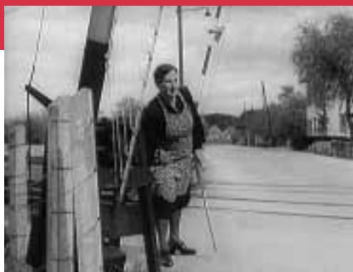
Filmstill «Männer der Schiene»

Wir haben eine Auswahl getroffen aus unzähligen audiovisuellen Dokumenten, die in den letzten Jahren in Zusammenarbeit mit seinen Mitgliedinstitutionen* erhalten werden konnten und die heute dem Publikum