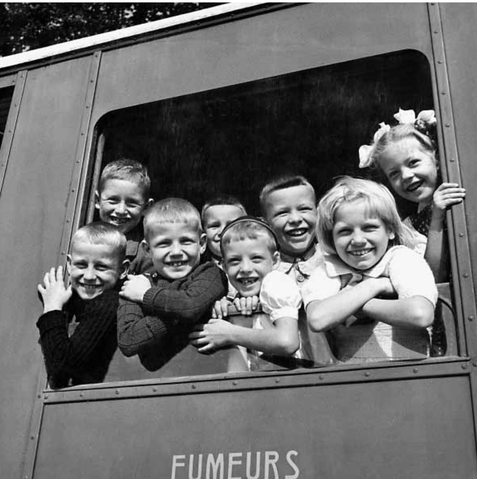
Enfants à la fenêtre d'un wagon fumeur, ca. 1940–1950