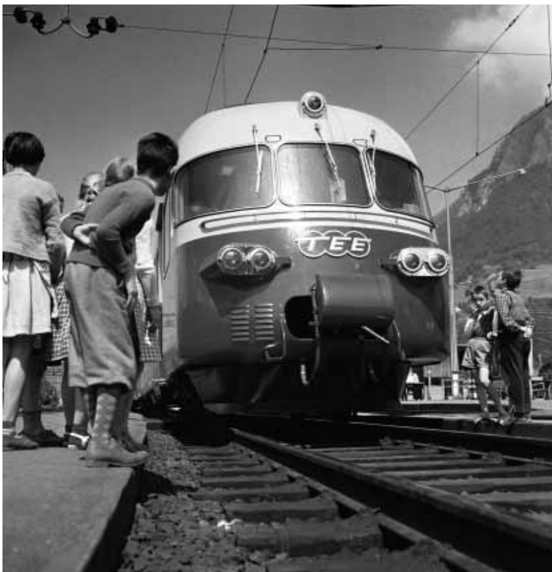
Der schweizerische Vierstromzug RAe TEE, von der Jugend bestaunt. SBB-Werbeaufnahme für den damals brandneuen Triebwagenzug von 1961.

Um ihre Ziele zu erfüllen, arbeitet die Stiftung mit Museen – hauptsächlich mit dem Verkehrshaus der Schweiz in Luzern –