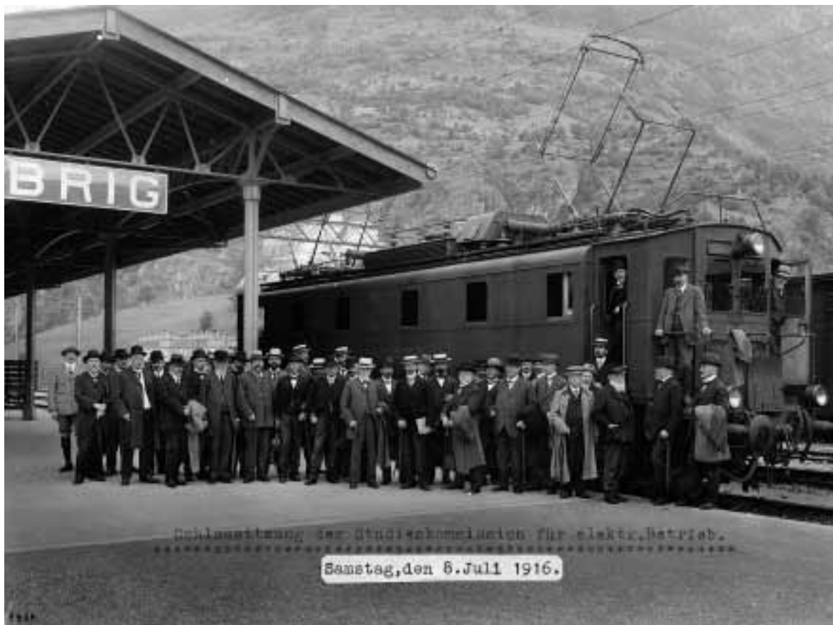
Gruppenporträt vor Elektrolokomotive Be 5/7 Nr. 152 der BLS im Bahnhof Brig Aufnahme Nr. 9504 aus der Glasnegativsammlung Brown Boveri & Cie (BBC)