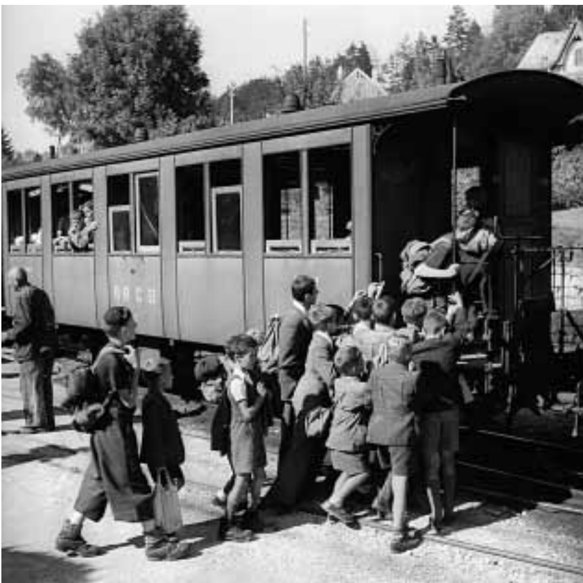
Kinder steigen in die Bahn in Le Locle 1946

Parallel zur Auswahl für die Bahnexpo 03 stellten wir Fotografien zusammen, die wir in unser seit 1999 im Aufbau befindliches digitales Bildarchiv aufnehmen werden. Bildmaterial, das oft jahrzehntelang unbenutzt lagerte, erhält dadurch wieder Aufmerksamkeit, denn die Bedingungen der Recherche für tagesaktuelle Medien in einer Bildokumentation bringen es je nach