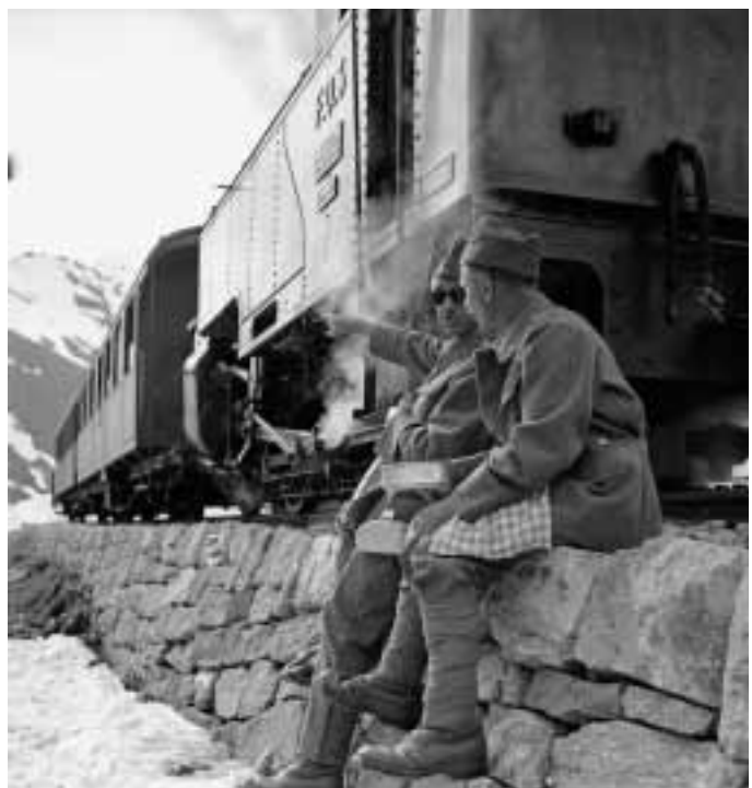
Isler: Schneeräumung an der Furka, Pause 1939/1945 © Schweizerisches Bundesarchiv