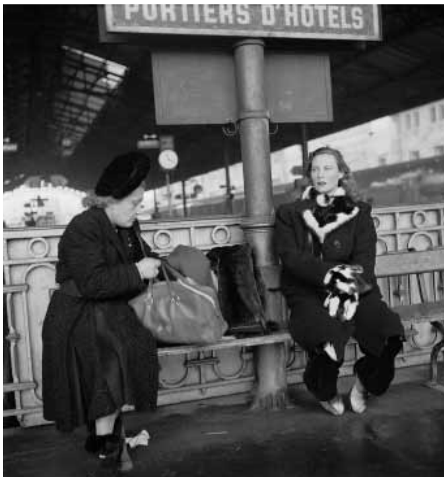
Michèle Morgan am Bahnhof Lausanne, 1946

Die Suche nach «digitalisierungswürdigen» Dokumenten rückt also «vergesene» Archivbilder, vermeintlichen «Ausschuss», vom Schatten ins Licht. Bestenfalls werden die Fotos dabei nicht nur nach dem Aspekt einer kurzfristigen Rentabilität ausgewählt. Die Chance besteht, dass der kulturhistorische Wert von Sammlungen als Ganzes erkannt und mit den nötigen – finanziellen – Mitteln gewürdigt wird.