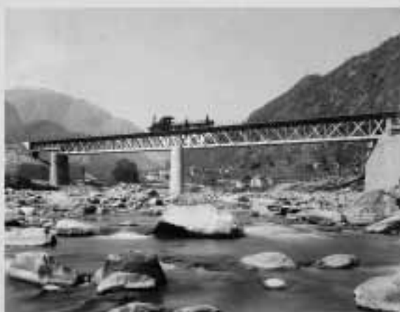
Adolphe Braun: Gotthardbahn – Untere Tessinbrücke mit Giornico © Musée de l'Elysée

Die Originalabzüge aus der Sammlung der Stiftung des Elysée wurden durch das Institut zur Erhaltung der Fotografie in Neuenburg mit Unterstützung von Memoriav restauriert und digitalisiert.