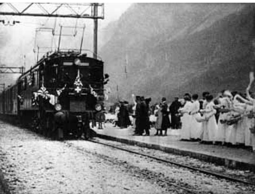
Filmstill «Die Fahrt mit der Lötschbergbahn», 1913 © Cinémathèque suisse

Verwendet mit freundlicher Genehmigung des Schweizerischen Bundesarchivs und von Movendo