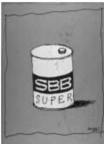
SBB Super Herbert Leupin

Schweizerische Landesbibliothek, Bern (Projektkoordination) / Bibliothèque nationale suisse, Berne (coordination du projet); Schule für Gestaltung, Basel; Bibliothèques publiques et universitaires, Genève et Neuchâtel; Museum für Gestaltung Zürich; Archiv Verkehrshaus, Luzern; Médiathèque Valais - Martigny online: www.snl.ch/posters