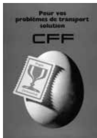
Pour vos problèmes de transport solution CFF Hans Peter Schaad, 1968