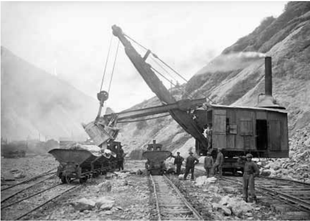
Construction de la ligne du Lötschberg: chargement de wagonnets, région de Brigue