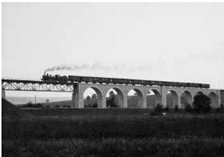
Dampfzug der Moutier-Lengnau-Bahn MLB/BLS auf dem Mösli-viadukt zwischen Lengnau und Grenchen Nord, um 1920

Ein weiteres Highlight des «Regionalen Gedächtnisses» ist der vom Museologen und