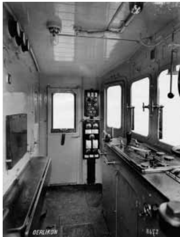
Führerstand der Elektrolokomotive Be 5/7 Nr. 153 der BLS, ca. 1913

dans le cadre du projet «Swiss Poster Collection». Les collections photographiques sont axées sur l'histoire des transports et des véhicules en Suisse, le transport ferroviaire et le transport aérien étant en l'occurrence privilégiés. Quelques collections sont classées par thème (par exemple en fonction de la société d'exploitation, du type de véhicule, du nom d'un pionnier, etc.) et déposées sous forme d'épreuves dans des classeurs et des boîtes. D'autres forment un ensemble à cause de leur provenance. C'est ainsi que les archives de l'industrie suisse des transports (BBC Brown Boveri & Cie, SLM Schweizerische Lokomotiv- und Maschinenfabrik Winterthur, MFO Maschinenfabrik Oerlikon) ont fourni d'importants fonds de photos d'entreprises. A Bahnexpo 03, en plus de ces prises de vues, les archives des transports présenteront aussi des photographies provenant de la collection Trechsel, constituée de négatifs sur verre. Cette collection rassemble quelque 400 négatifs sur verre datant de 1900 à 1930 et montrant des locomotives à vapeur autrefois en service dans les chemins de fer suisses.