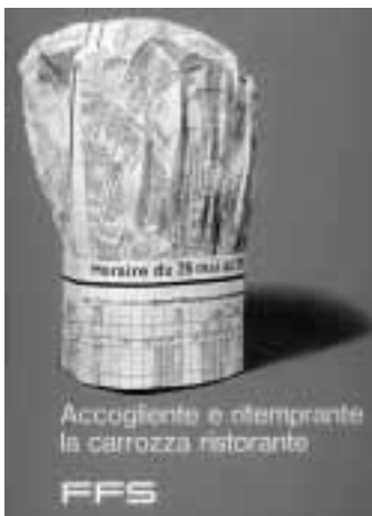
Accogliente e ritemprante la carrozza ristorante FFS Paul Niederhauser, 1965