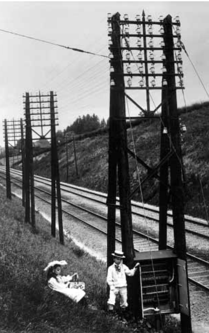
Streckenabschnitt Bern–Worblaufen, ca. 1903

Das Museum unternimmt seit Jahren grosse Anstrengungen im Bereich der Erhaltung und Konservierung und hat darin zum Teil Pionierarbeit geleistet. Das Projekt der Sicherung der gefährdetsten Bestände an Zellulosenitrat und -acetat Fotonegativen und Filmen ist bereits weit fortgeschritten. Zur optimierten Lagerung der Originale besitzt das Museum glücklicherweise speziell klimatisierte Depoträume. Bei den noch anstehenden Projekten ist jedoch auch das Museum künftig vermehrt auf die Zusammenarbeit mit den in Memoriam zusammengeschlossenen Partnerinstitutionen angewiesen.